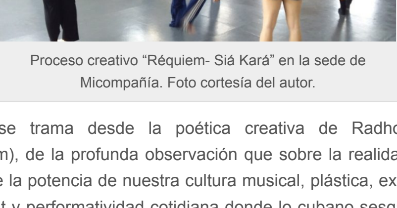
Proceso creativo "Réquiem- Siá Kará" en la sede de Micompañía.

Creación que sitúa al cuerpo y su presencia en cualidad de laboratorio interpalante de lo "disperso" que produce sentido en sus vínculos imaginación-acción, actor-espectador, movimiento-acción, ritmo-armonía, cuerpo-pensamiento, centro-periferia, vida-muerte. Así, Villa Lola (sede de Micompañía) dispone su espacio, apuesta por el ejercicio especulativo de una otra lengua franca que explora la comunaldad de cuerpos culturalmente mediados ante la irresolución de un posible modelo global: oportuno modo para re-actualizar el lugar de las teorías en las prácticas de la danza, más que externamente normativas, integradas, amplificadoras del discurso y pensamiento coreográficos.