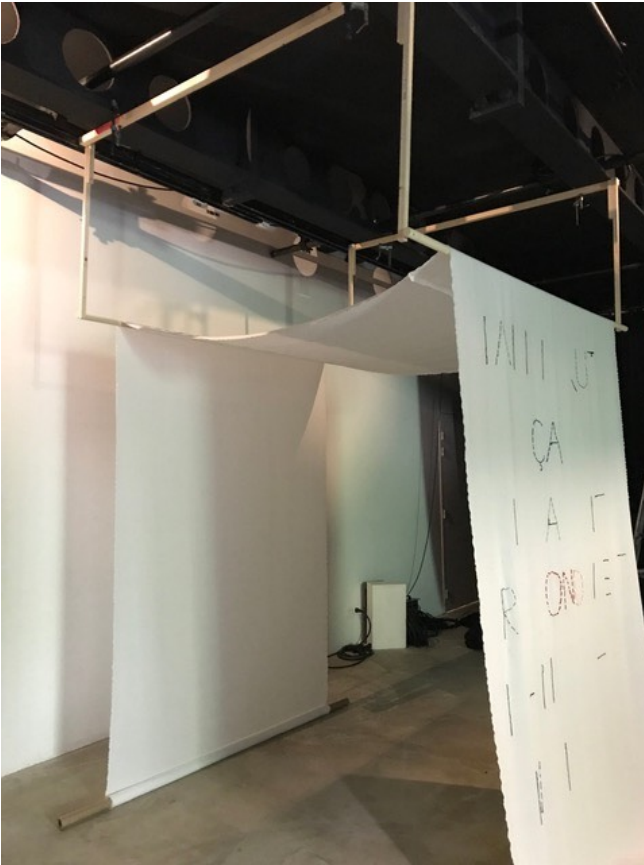
DISPOSITIF D'ACCROCHE DE LA TOILE