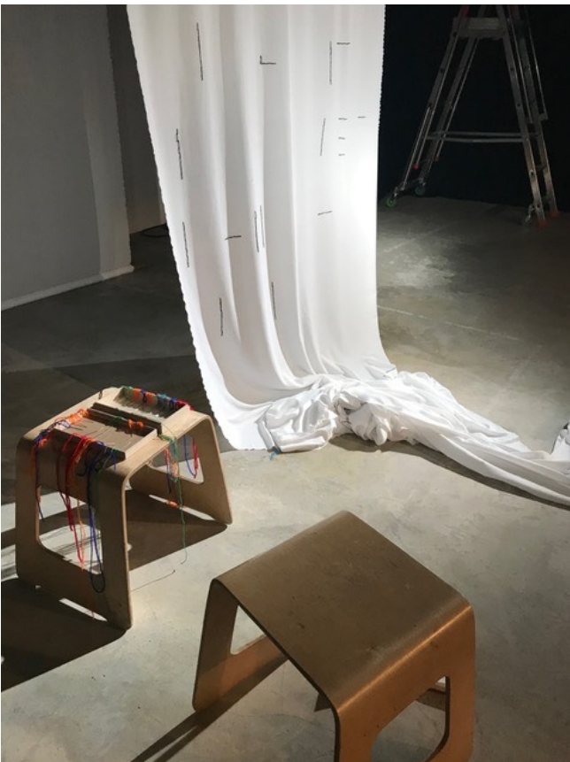
TOILE ET TABOURETS (tabouret : modèle Ikea Benjamin)